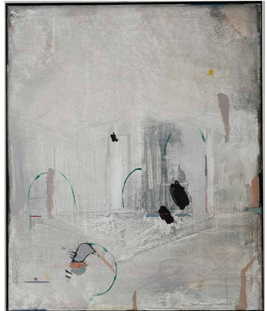
Die Neuordnung der Dinge (hell), 2014 Öl auf Leinwand, 60 x 50 cm