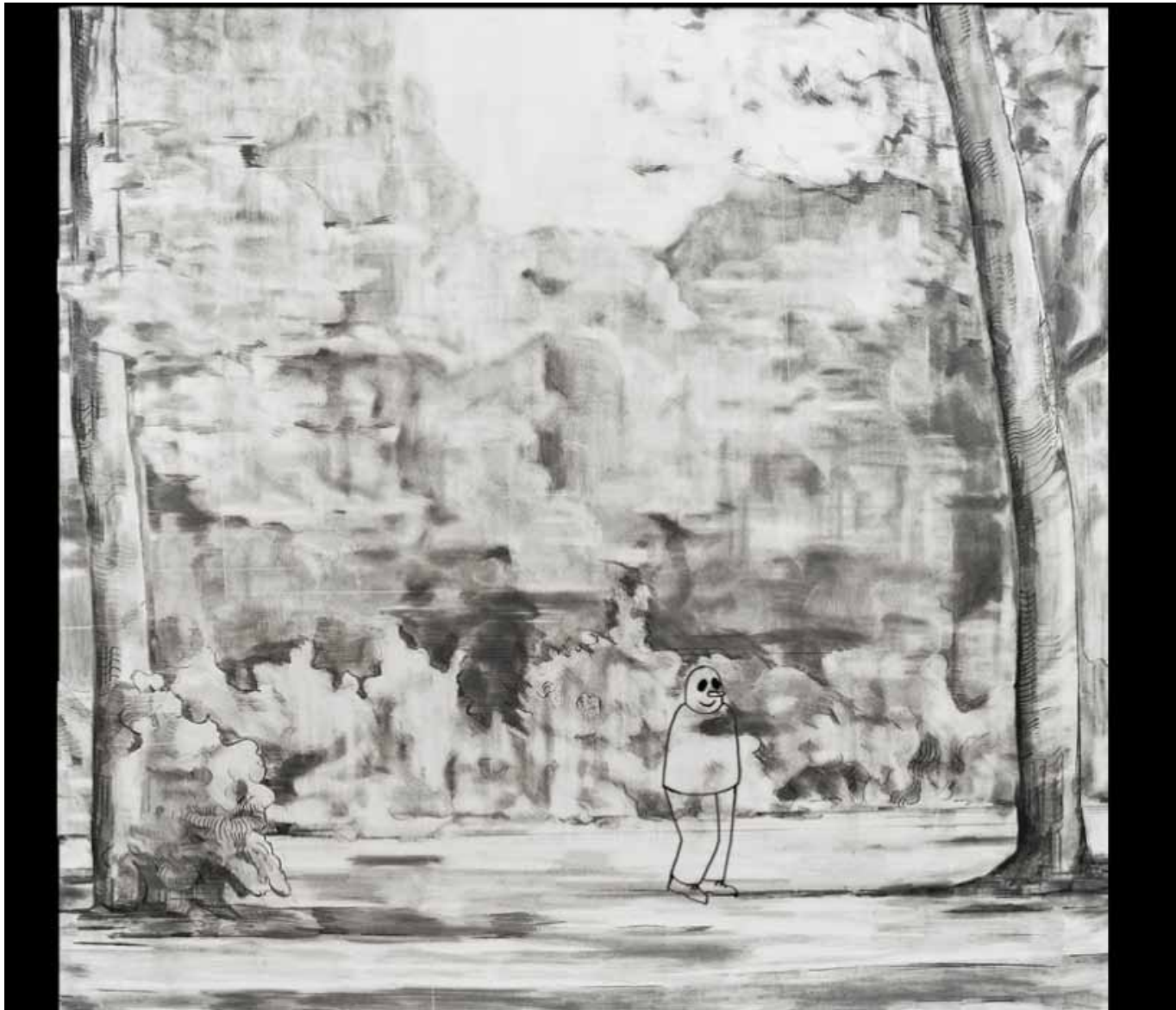
Wie die Anst der Kunst das Fürchten lehrte, 2014 Video 1:47 min Filmstill