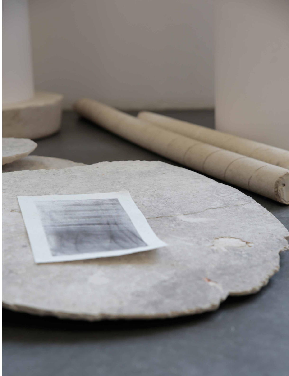
Exploded Drawing / Stille, 2014 Graphit auf Papier, 15 x 20 cm Installationsansicht