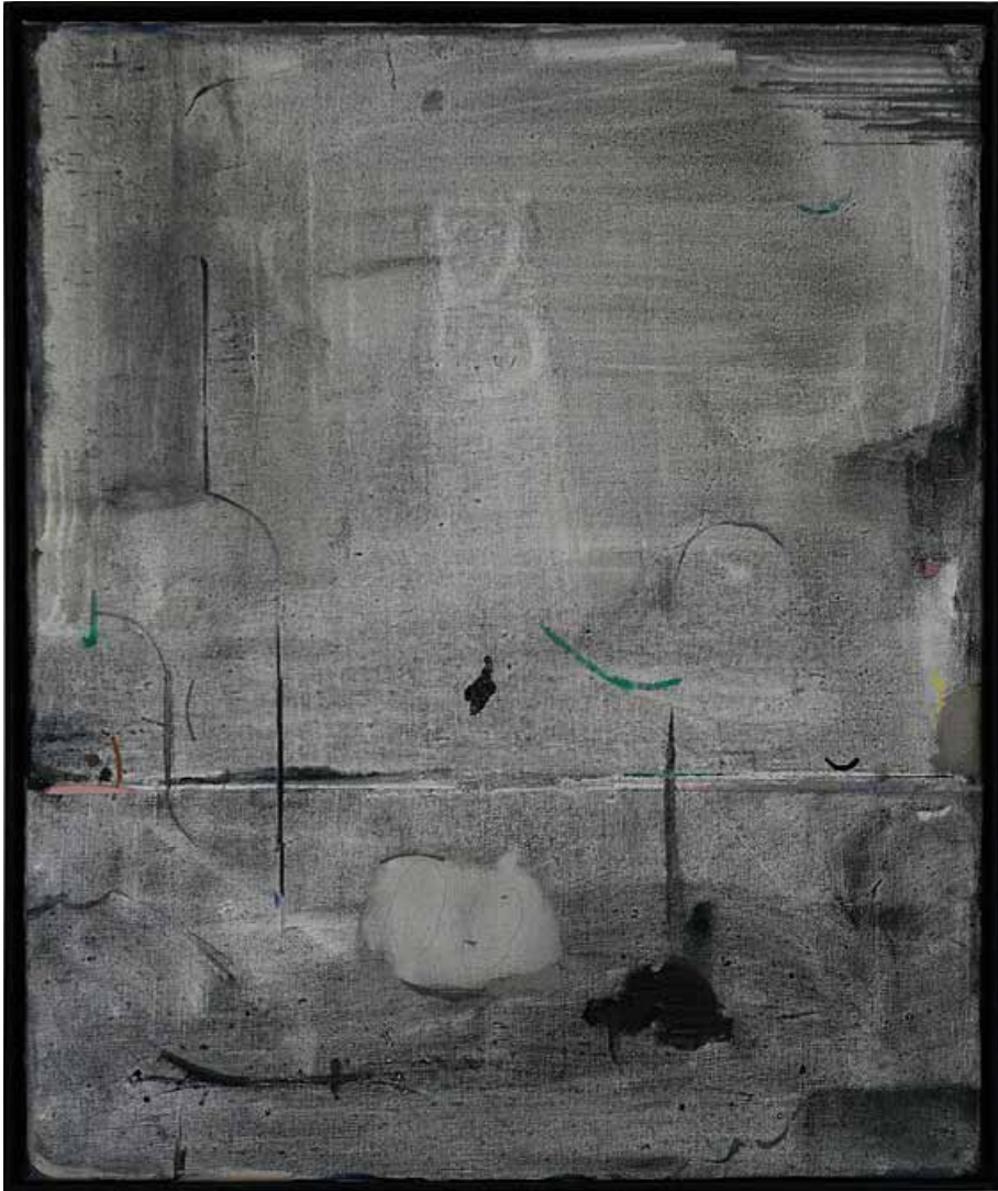
Die Neuordnung der Dinge (dunkel), 2014 Öl auf Leinwand, 60 x 50 cm

Die Malereien präsentieren Neuordnungen als Utopie, ohne ordnendes Subjekt und fassbare Dinge, letztlich als Leerstelle und blinder Fleck im System. Dieser wird auch durch mögliche Identifikationsfiguren oder erzählerische Momente nicht aufgelöst. Die versprochene Neuordnung der Welt entlarvt sich selbst als totalitärer Erklärungsversuch.