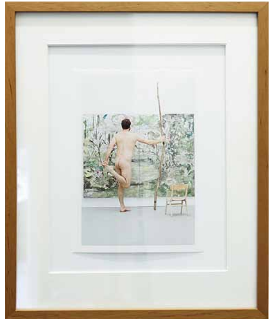
Wie (man) der Kunst den Kampf erklärt, 2014 Inkjet Print auf Papier, 21 x 15 cm