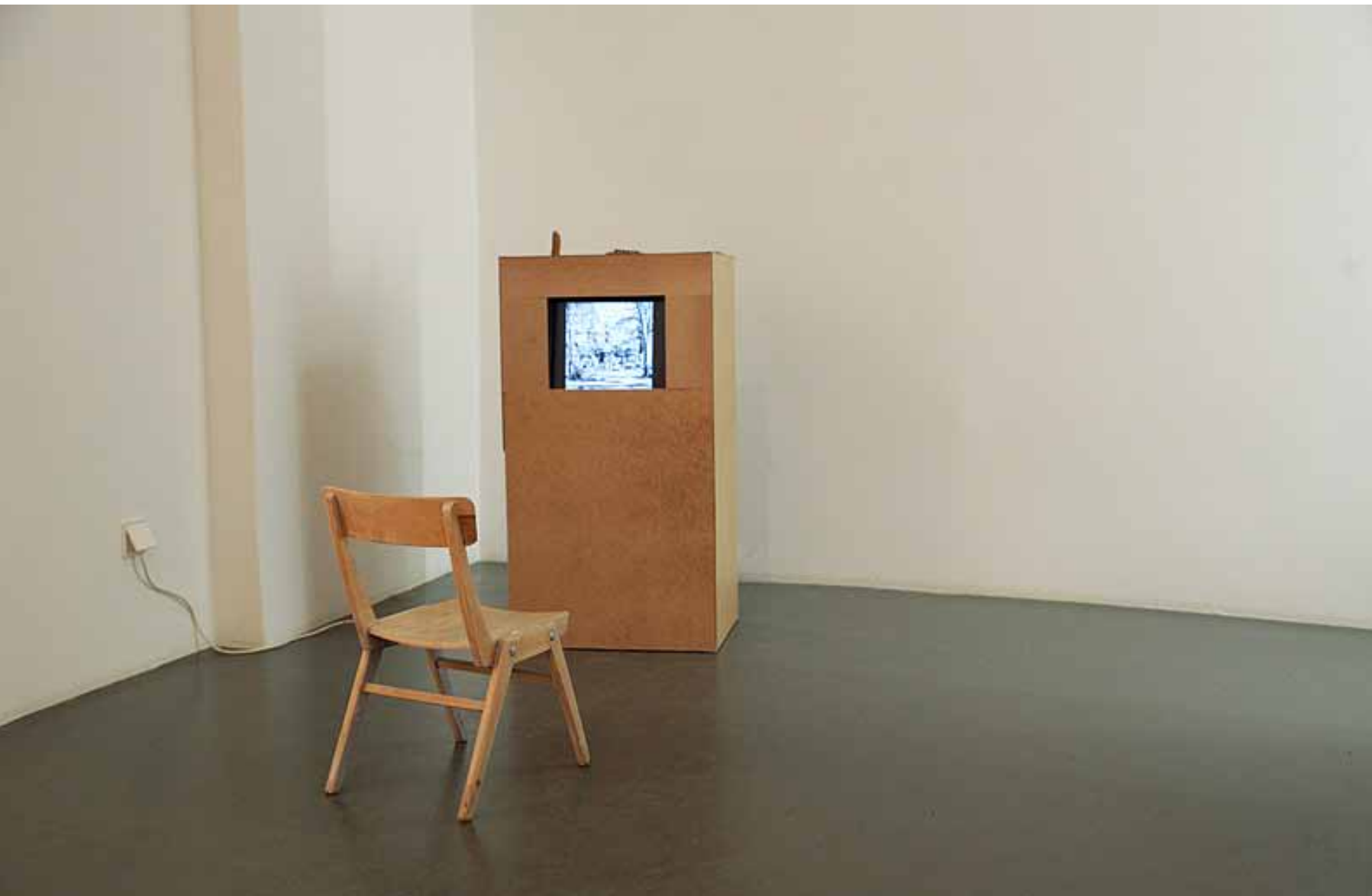
Wie die Anst der Kunst das Fürchten lehrte, 2014 Video 1:47 min Installationsansicht