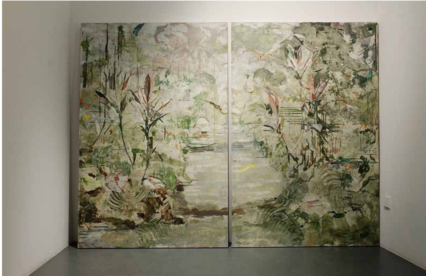
Landschaft betrachten (Garten), 2013 Öl auf Holz, 175 x 230 cm