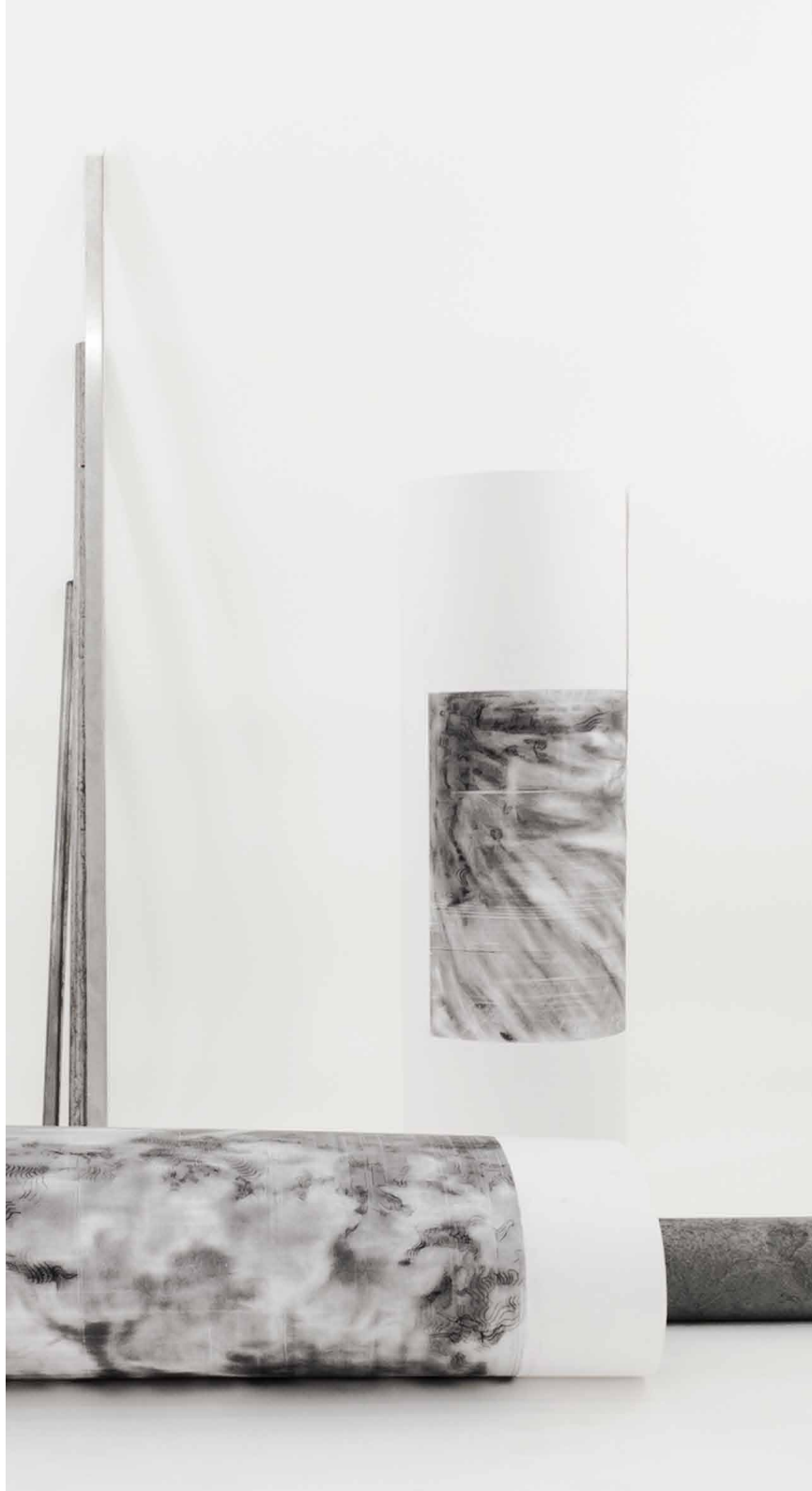
Exploded Drawing / Sprengung, 2014 Tusche, Graphit auf Papier, 50 x 45 cm